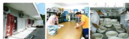
ワークスペースなごみ