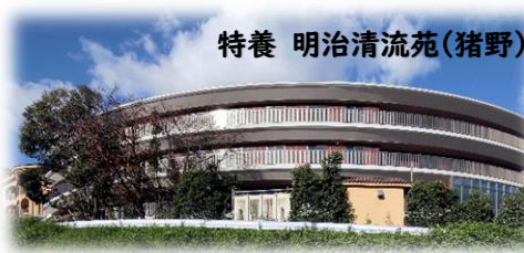
特養 明治清流苑(猪野)